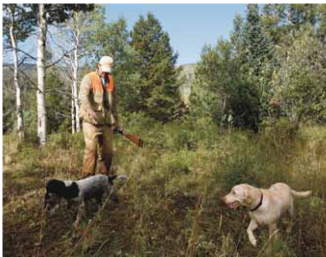
Le milieu est très dense : sapins, bouleaux et végétation haute au sol qui rend l'approche difficile.

vers l'énorme tout terrain. Bella a cinq ans et une robe orange rouan. Elle regarde son maître avec des yeux langoureux attendant ses ordres.